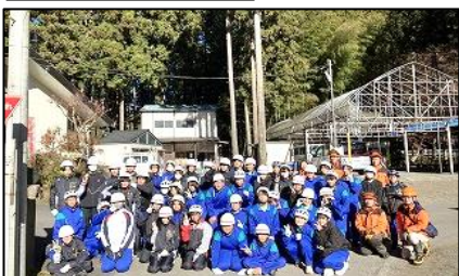
間伐作業(さかな園)

12月12日(木) さかな園にて「東京都森林組合」のご指導の下、間伐作業を体験しました。背の高い間伐材が倒れた時のドスンという音にびっくりしていました。生徒たちは3班に分かれ「間伐材の枝落とし」「丸太切り」や、てこの原理を利用したロープとの引っ張り体験、丸太をロープに引っ掛けて運ぶ作業等を学びました。次に原木市場や木材の流通について学習するために「多摩木材センター」に行きました。毎月2回、原木の売り買いの競り(せり)は、東京都内でこーか所しかないそうです。ちょうど先日、競りがあったため原木は少なめでした。最後に、元PTA会長の「浜中材木店」を見学しました。皮むき、製材、乾燥の見学・説明を受けました。木は育てる段階で間伐や枝打ち等の手入れをしっかり行うことで、節の少ない良質な木材ができます。市場で木を買い付ける場合、木を選ぶ「目利き」が必要となることを学習しました。