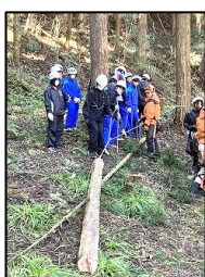
多摩木材センター