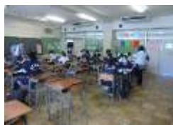
数独・間違い探し・漢字パズルで脳活