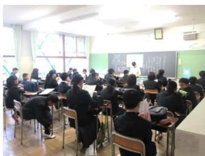
中学校生活 初の学活