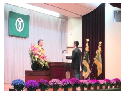
入学式 誓いの言葉