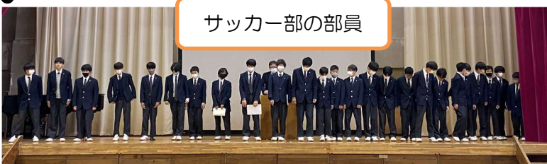
サッカー部の部員