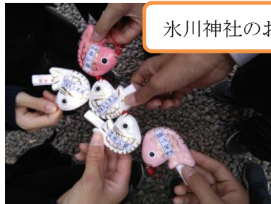
氷川神社のお守り