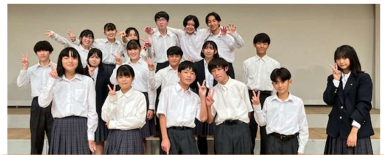
実行委員の皆さん ありがとう！