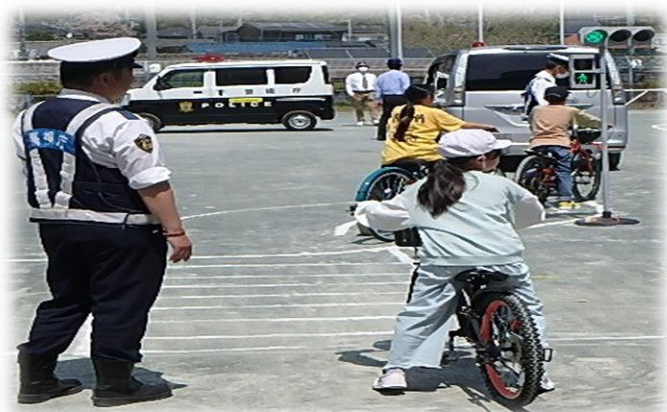
3・5年生：自転車の乗り

五日市警察の方々に日にちを分けて、全校児童に交通安全教室を実施していただきました。4月12日(金)は、1・2年生が安全な通学路の歩き方について、15日(月)は、3・5年生が学校の校庭で実際に自転車に乗って自転車の正しい乗り方について、19日(金)は、4・6年生がビデオで交通ルールを守る態度についてと自転車の正しい乗り方の振り返りを行いました。どの学年の子供たちも五日市警察の方のお話を真剣に聞いて交通安全について学ぶことができました。ご家庭でも、交通事故を絶対に起こさないように、お子さんの安全な歩行や自転車の乗り方を確認してください。