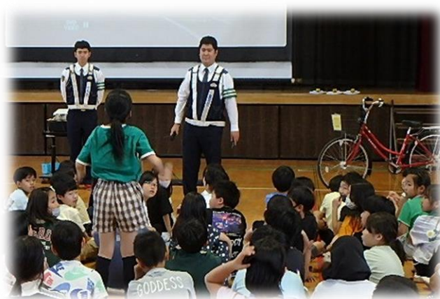
4・6年生：交通ルール