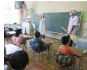
【給食センター訪問】