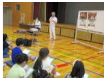
【町内会長さんの地域学習】(昨年度中止)